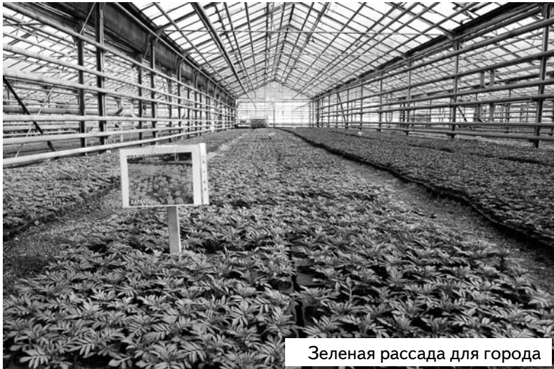
Зеленая рассада для города

По вопросам качества уборки дорог жители Ульяновска могут обращаться в диспетчерскую МУП «Ульяновскдорремсервис» по телефону (8422) 35-40-78, по вопросам расчистки внутридворовых территорий - в Единую диспетчерскую службу по телефону «05».